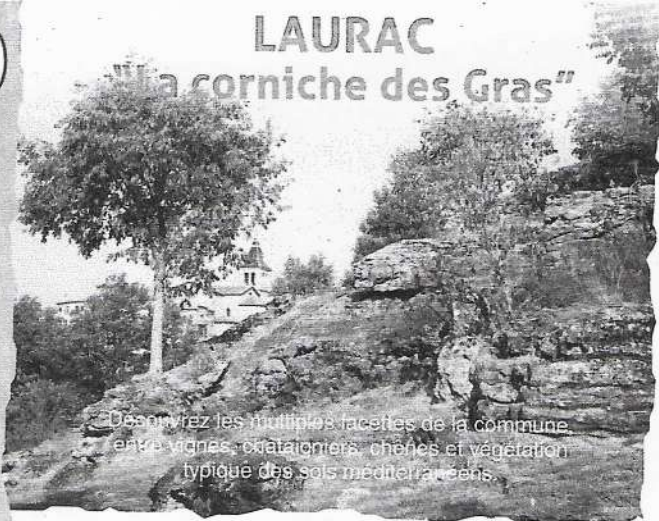
Découvrez les multiples facettes de la commune, entre vignes, châtaigniers, chênes et végétation typique des sols méditerranéens.